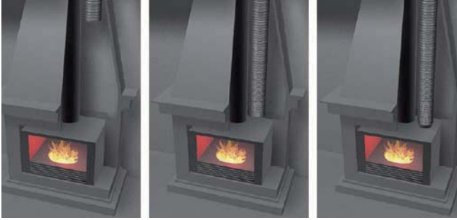
En sortie de chambre de décompression